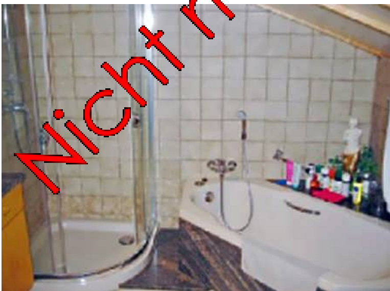
Bad im Wohnhaus