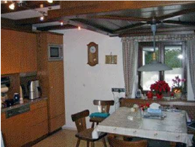
Küche im Wohnhaus