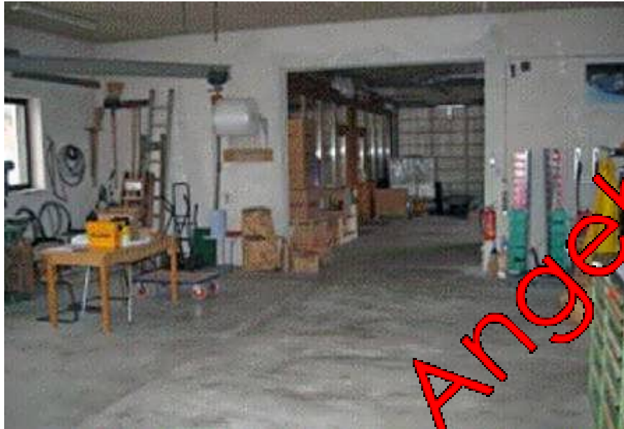
Blick in die 1990 erbaute Halle