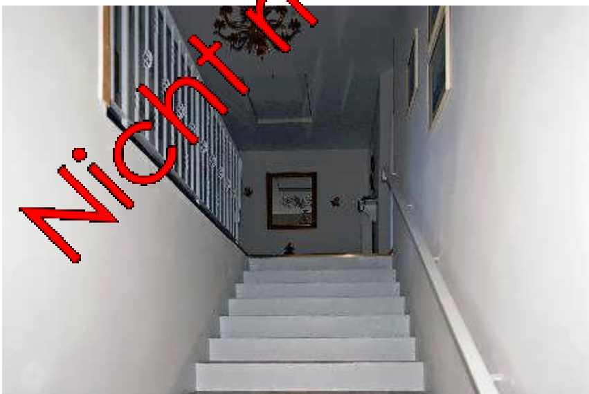
Treppe zum Obergeschoss