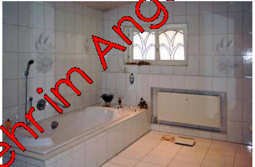
Bad im Erdgeschoss