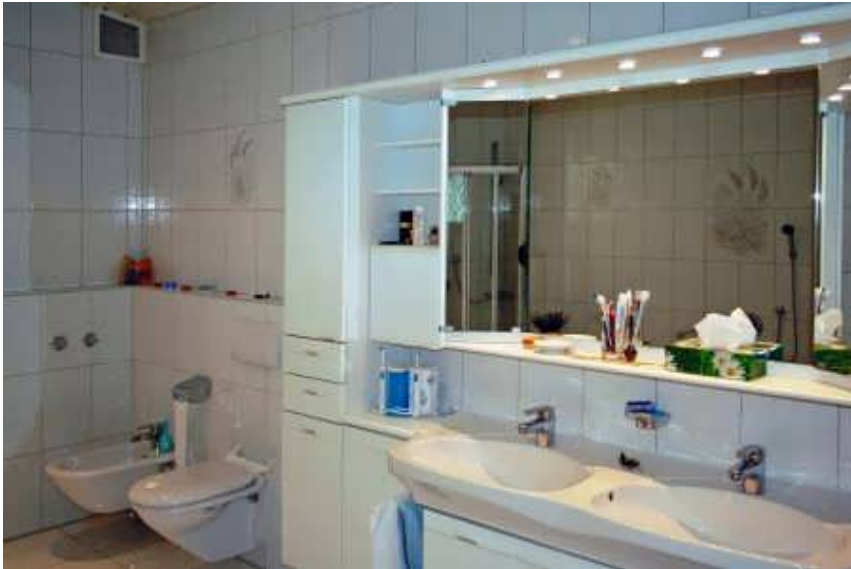
Bad im Erdgeschoss