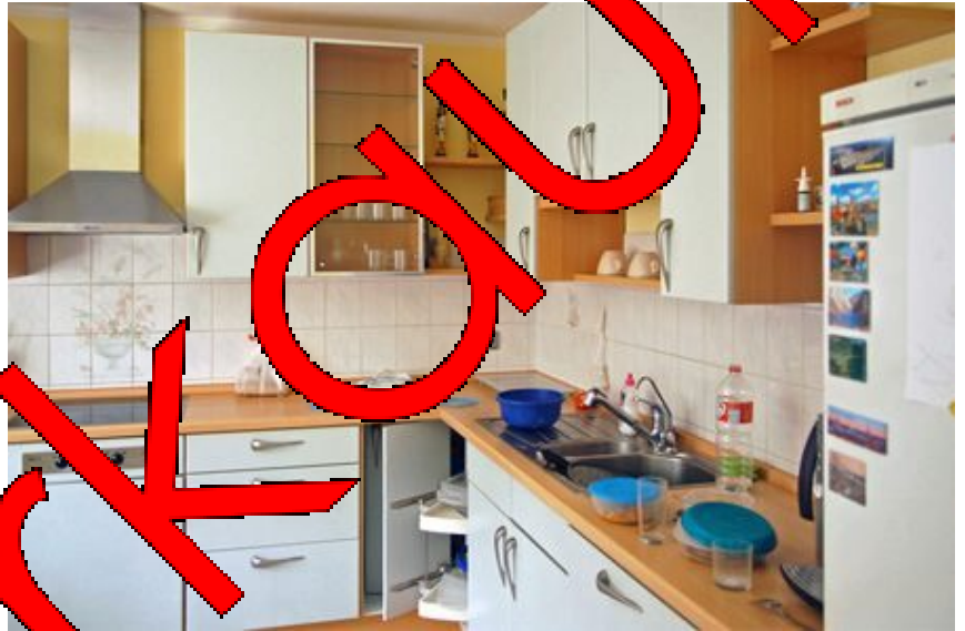
Küche WG. 2