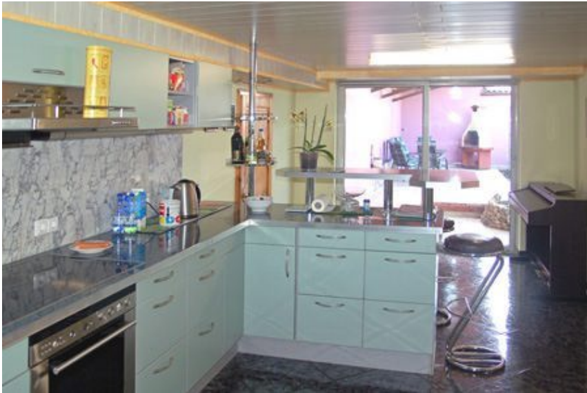
Küche WG. 1