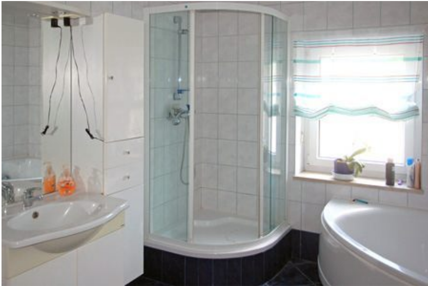
Bad WG. 2