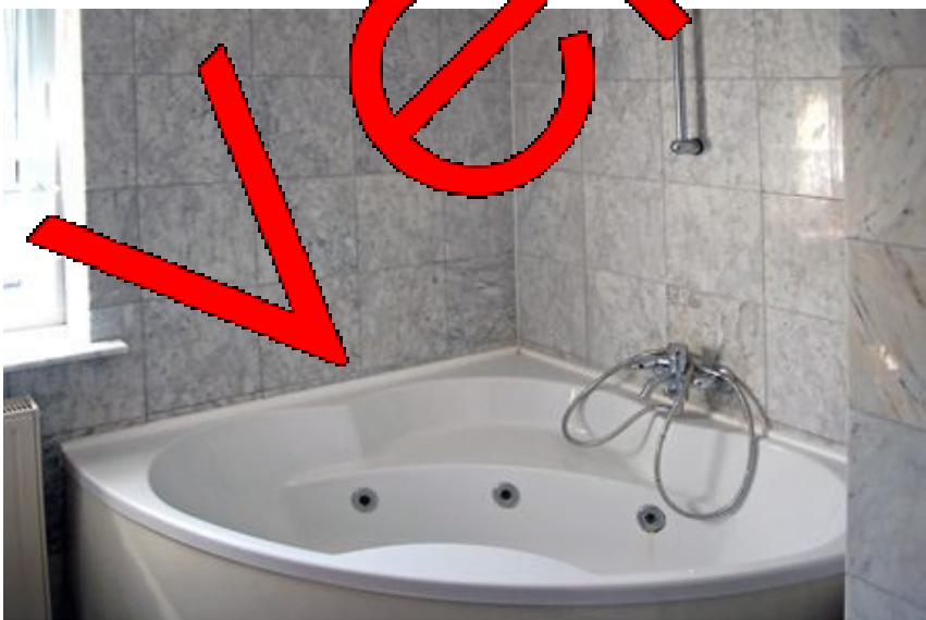
Bad WG. 1