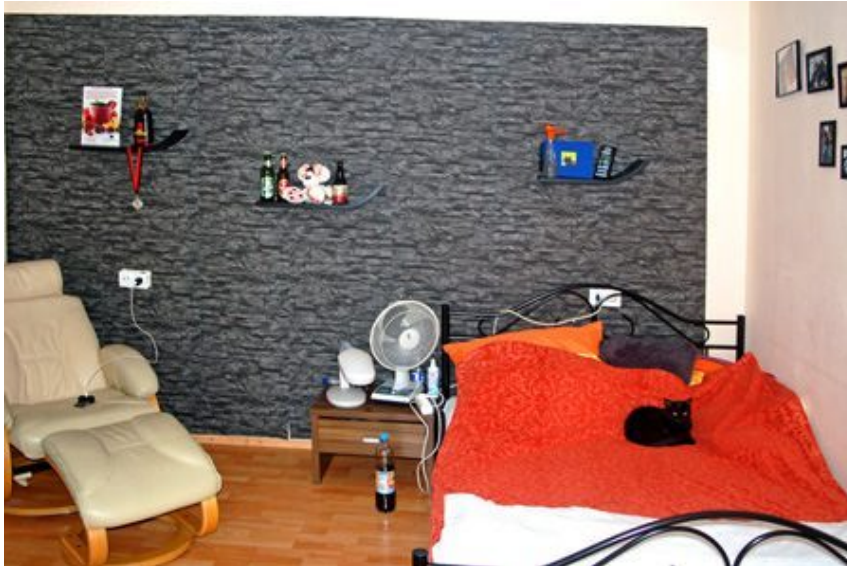
Jugendzimmer WG. 1