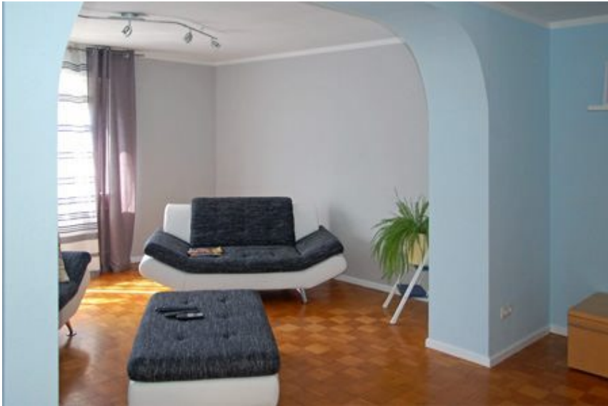
Wohnzimmer WG. 2