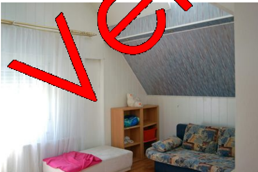
Gästezimmer WG. 1