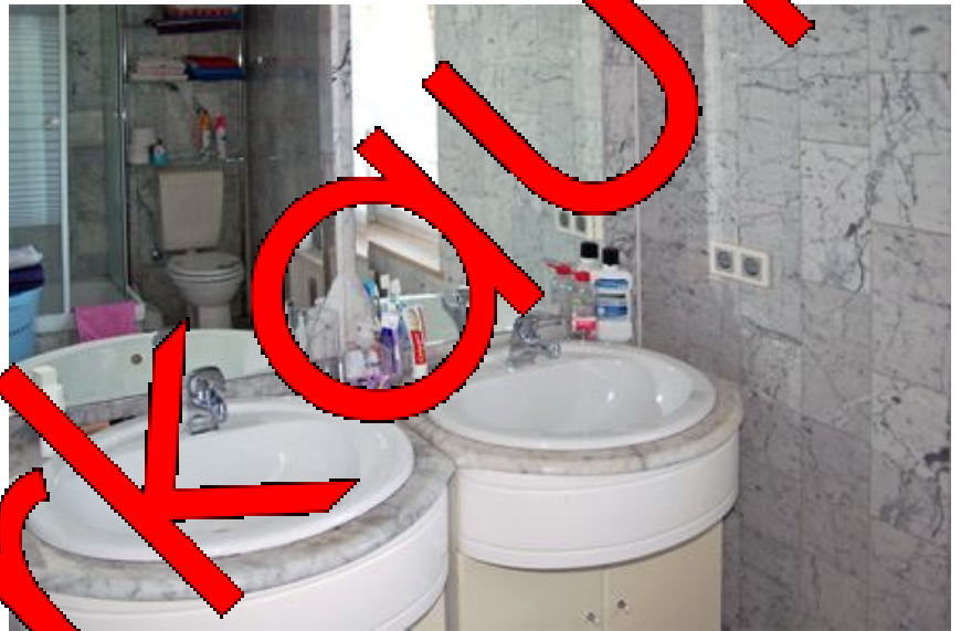
Bad WG. 1