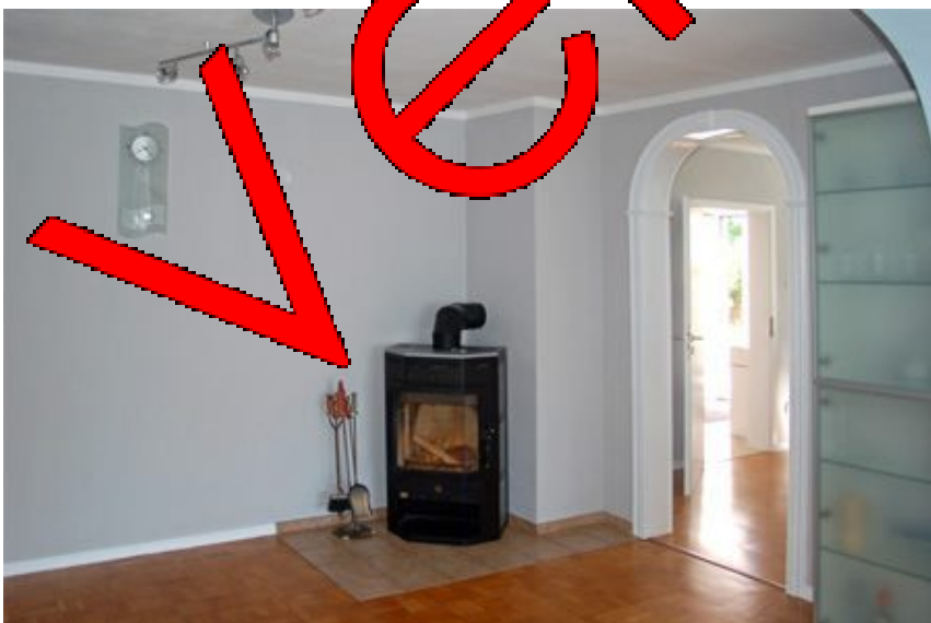
Ofen WG. 2